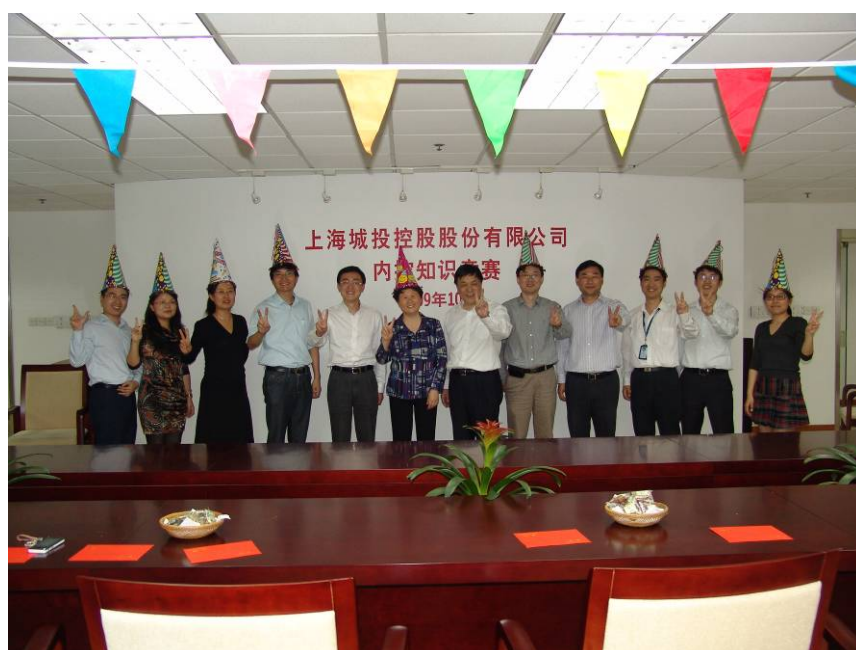
内控知识竞赛选手与评委合影

加强内部控制 2009 年，城投控股内部控制体系不断加强、完善。2 月中旬，公司正式启动环境集团、置地集团内控项目；6 月中旬至 7 月底，开展上半年度内控检查工作，对公司本部、置地集团、环境集团、11 家三层次公司、1 家分公司自评流程的实际执行情况进行了全面内控检查，并对上阶段梳理出来的内控设计缺陷改进点均做了跟踪检查；12 月 1 日，启动 2009 年度内控自评工作，12 月下旬启动 2009 年度内控检查监督工作。11 月，公司正式出版控股本部、环境集团、置地集团的内控手册，并发放至各位员工。