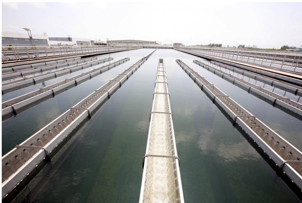
自来水闵行公司下属水厂沉淀池

业产值能耗为 0.8000 吨标煤，同比下降 19.43%。单位供水电耗为 226.46 千瓦时/千吨，同比下降 2.28%。其中二水厂单位供水能耗为 186.62 千瓦时/千吨，同比下降 0.57%，源江水厂单位供水能耗 202.91 千瓦时/千吨；泵站输配能耗为 36.45 千瓦时/千吨（含新桥泵站为 40.19 千瓦时/千吨），同比下降 14.2%。