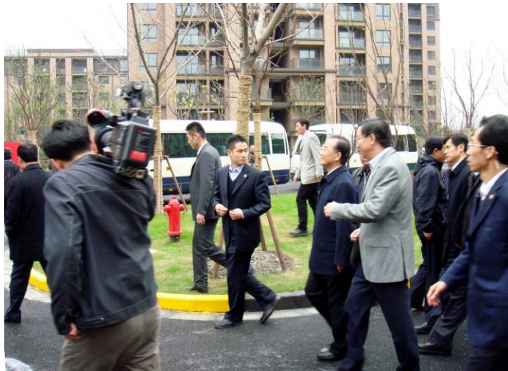
温家宝总理视察新凯家园二期

在保障性住房建设方面，公司积累了有益经验。一是总体规划显人性。充分利用置地集团在成片土地开发中所积累的实践经验，坚持科学的规划导向原则，从商业布点、文教卫生、休闲娱乐、绿化景观等各方面进行系统化设计，将人性化、细节化的思考融入规划中。如通过拉开景观水系和城市道路的间距，创造适宜步行尺度的中央景观休闲带，并在绿化休闲带中铺设健身步道等。二是个性设计显品质。集团技术核心部门坚持高起点规划，高标准设计，总结既往经验，针对保障性住房项目内外部条件的差异，考虑项目所在区位、周边条件及项目本身规划限制，从特点和需求的差异化出发，精心控制设计成果，对规划、户型、立面和材质设备进行优化，设计出一批功能合理、造型美观、环境优美、造价经济、可持续发展的个性化住宅项目。三是标准统一显水平。通过开展《保障性住房设计与技术应用研究》课题，对已建、在建项目经验进行总结提炼，着重掌握普遍规律，为今后项目的开发提供技术支撑。课题根据保障性住房建设项目的特