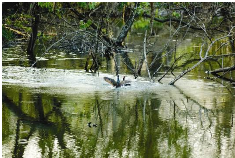
置地集团新江湾城湿地公园一景

在保护原有水体的基础上，新江湾城还规划建设湖泊和河道，采取浅滩缓坡和植物生态护坡，既形成丰富的湿地景观，又净化水体，营造人与水亲近的环境。