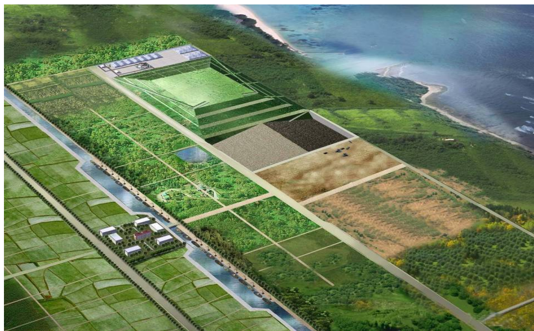
老港生活垃圾卫生填埋场四期工程

在生产运营中，公司在努力降低生产过程中的能耗同时，加强对垃圾焚烧和卫生填埋场业务的减排工作。2009年，在污水污染物减排方面，上海江桥生活垃圾焚烧厂减排 COD 4865 吨、BOD 3716 吨、NH 3 -N 90 吨；在烟气污染物减排环节，减排 SO x 2843 吨。成都洛带城市生活垃圾焚烧厂在污水污染物减排环节，减排 COD 4317 吨、BOD 3297 吨、NH 3 -N 80 吨；在烟气污染物减排环节，主要污染物如 SO 2 、HC1、烟尘的排放量分别减少了 2398 吨、1059 吨、5394 吨。上海老港生活垃圾卫生填埋场（四期）在污水污染物减排环节，减排 COD 12482 吨、BOD5778 吨、NH 3 -N 1656 吨。上海老港生活垃圾卫生填埋场（四期）工程 2009 年碳减排量约为 9.6 万吨。