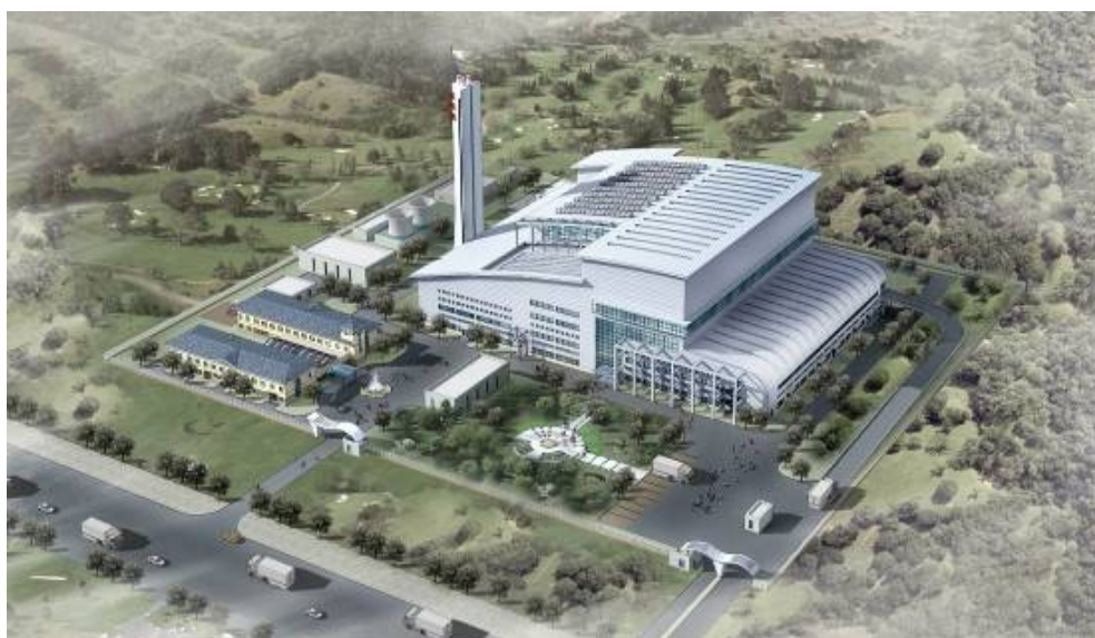
环境集团建设运营的西南最大最先进的焚烧厂——成都生活垃圾焚烧发电厂

和袋式除尘等技术工艺，确保主要烟气排放指标完全符合国家标准，对产生的飞灰进行固化稳定处理或送往危险废物填埋场安全处置。这些环保措施的运营，将有效确保项目运营的安全、环保，对城市和区域环境质量的提高都具有显著的作用。