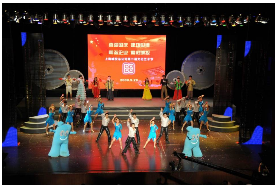
员工在文化艺术节上精彩演出

身的提高搭建了舞台，形成了共同促进、共同成长的局面。置地集团疏通了晋升通道，为员工提供了公平的竞争环境；同时又为处在职业生涯初期的青年员工提供了职业导航，帮助青年成长成才。对开发团队员工，集团近期拟进行新一轮“导师带徒”活动，拟确定 10 对师徒，徒弟以新进青年员工为主，导师以中青年骨干和资深员工为主，师徒结对，帮助青年树立学习榜样，发挥老员工“传、帮、带”作用。针对管理公司员工，集团将继续深化青年职业生涯导航活动，寻找企业发展与员工个人职业发展的契合点，根据青年员工的个人工作能力和自身业务特长，结合企业发展中长期规划中对不同工作岗位的要求，努力让青年员工，尤其是一线青年员工看到适合自身的职业道路，激发基层员工的工作积极性，为员工创造一个充分发挥自身才干的良好环境和展示舞台，进一步增强企业的持续竞争力和核心凝聚力。