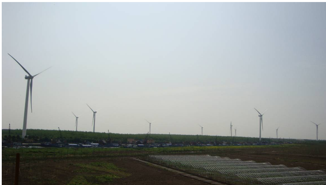
建设中的老港风力发电厂

在建的填埋气发电能力达到 15 兆瓦；老港与华电集团合资建设的风力发电项目一期装机容量达到 19.5 兆瓦。上述新能源项目全部建成后，将进一步增加公司的绿色电力年发电量，从而节约煤炭等不可再生资源，为建设资源节约型、环境友好型社会做出了一份贡献。