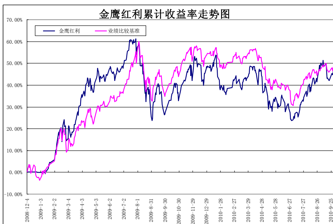
金鹰红利价值混合型基金累计份额净值增长率与同期业绩比较基准收益率的历史走势对比图 (2008年12月4日至2010年9月30日)

注：1、本基金合同于2008年12月4日正式生效；2、按基金合同规定，本基金自基金合同生效起六个月内为建仓期，截止报告日本基金的各项投资比例已达到基金合同规定的各项比例；3、本基金的业绩比较基准为：新华富时红利150指数收益率×60%+上证国债指数收益率×40%。