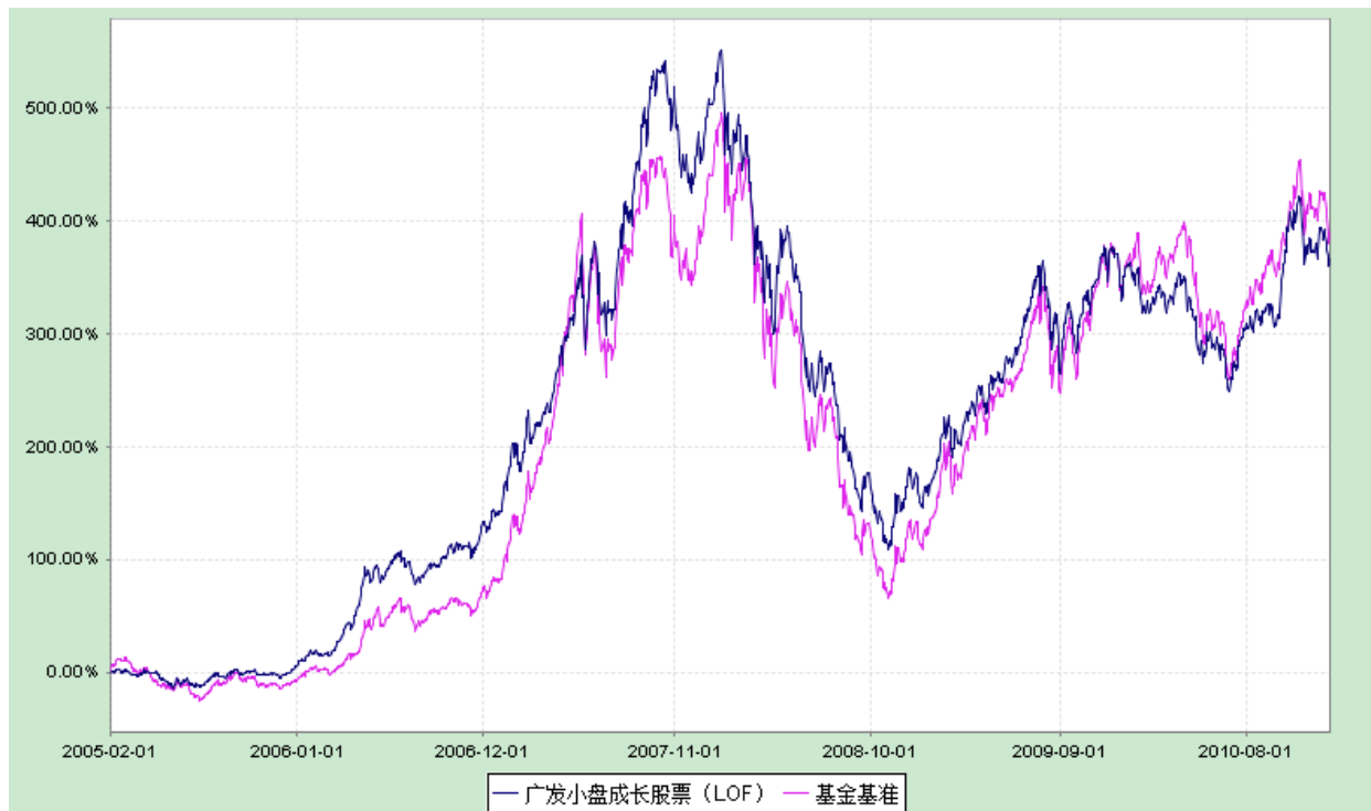
广发小盘成长股票型证券投资基金（LOF） 份额累计净值增长率与业绩比较基准收益率历史走势对比图 (2005年2月2日至2010年12月31日)