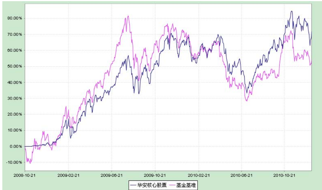
份额累计净值增长率与业绩比较基准收益率历史走势对比图 (2008 年 10 月 22 日至 2010 年 12 月 31 日)