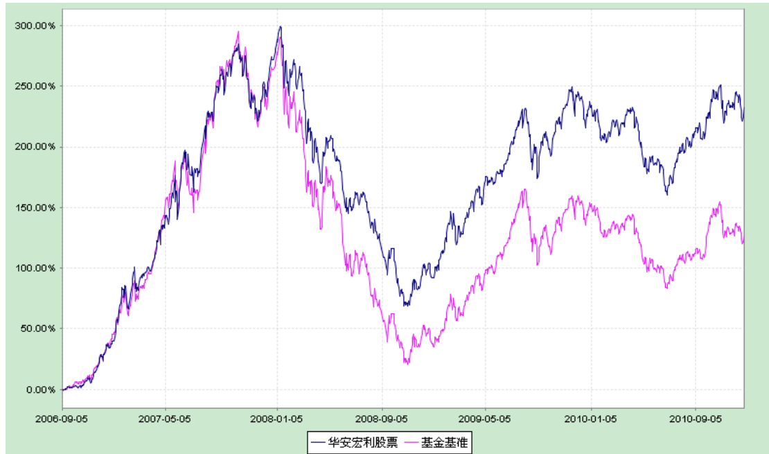
华安宏利股票型证券投资基金 份额累计净值增长率与业绩比较基准收益率历史走势对比图 (2006 年 9 月 6 日至 2010 年 12 月 31 日)