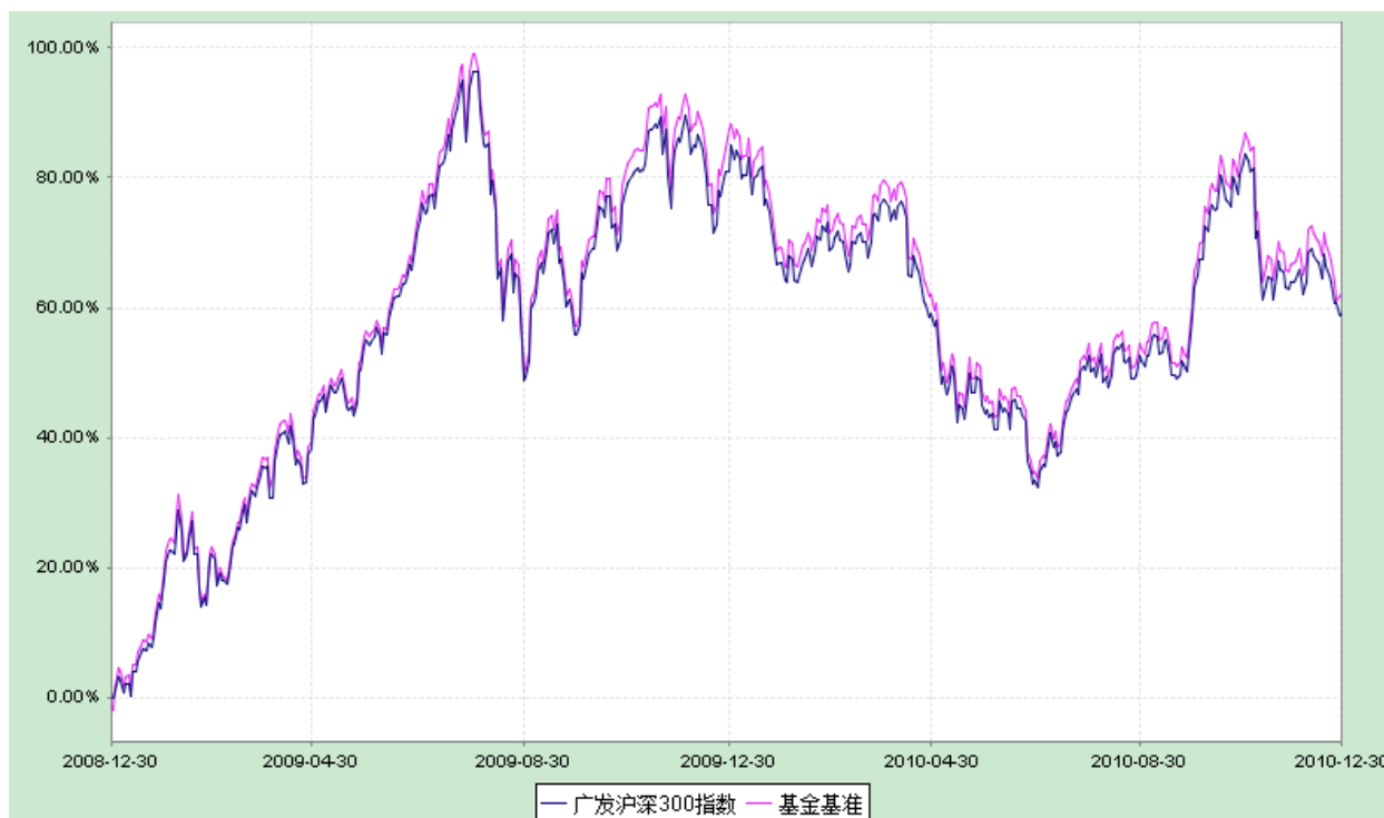
广发沪深 300 指数证券投资基金 份额累计净值增长率与业绩比较基准收益率历史走势对比图 （2008 年 12 月 30 日至 2010 年 12 月 31 日）

注：本基金建仓期为 2008 年 12 月 30 日至 2009 年 3 月 29 日，建仓期结束时本基金资产配置比例符合本基金合同有关规定。