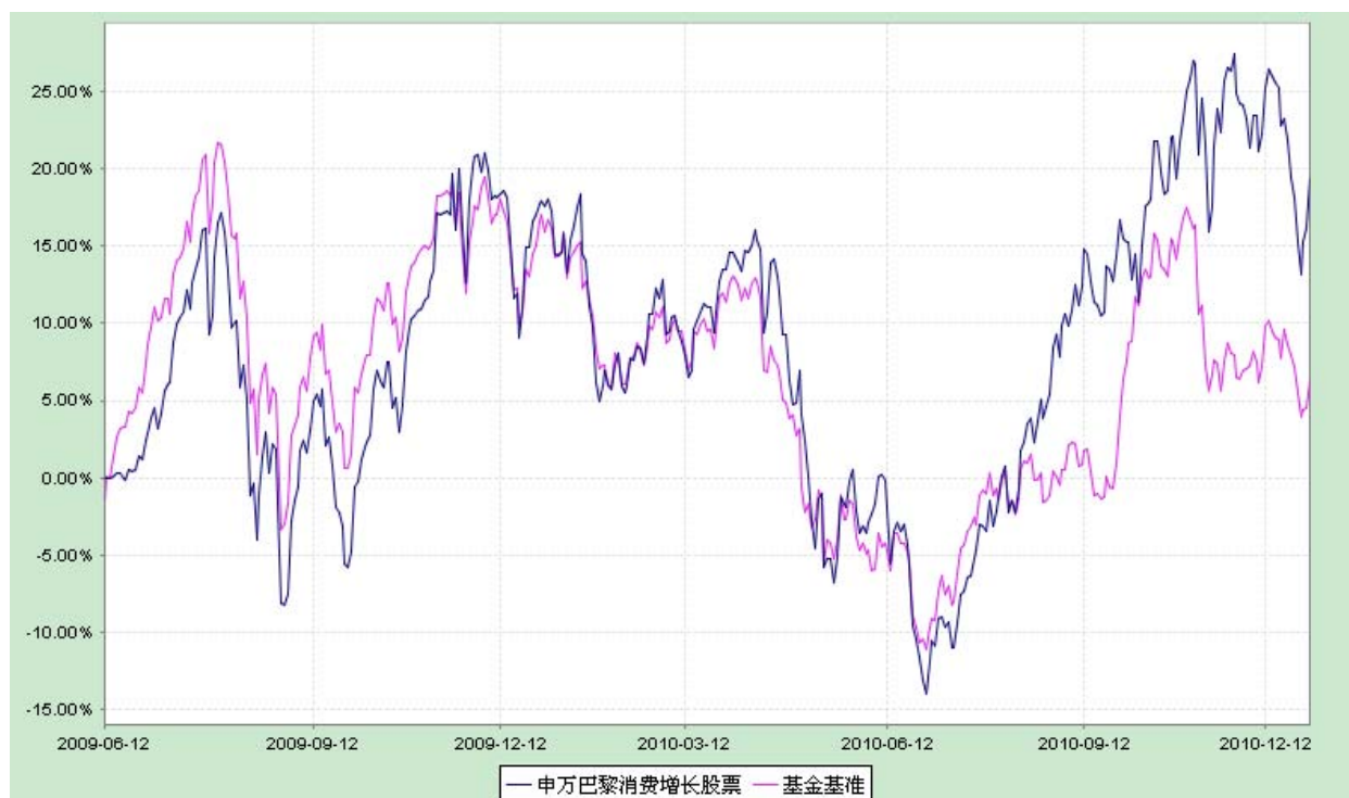
申万巴黎消费增长股票型证券投资基金 份额累计净值增长率与业绩比较基准收益率历史走势对比图 (2009 年 6 月 12 日至 2010 年 12 月 31 日)

注：根据本基金基金合同，本基金的投资比例为：股票资产的投资比例占基金资产的 60%—95%；其中，投资于消费范畴行业的资产不低于股票资产的 80%；权证的投资比例不超过基金资产净值的 3%。债券资产的投资比例占基金资产的 0%—35%；现金以及到期日在一年以内的政府债券的投资比例合计不低于基金资产净值的 5%。上述投资比例限制自基金合同生效 6 个月起生效。