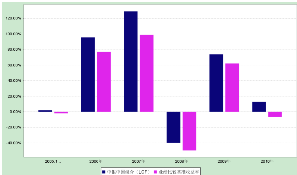
过去五年净值增长率图