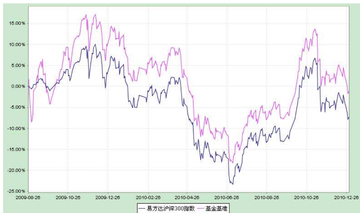
易方达沪深 300 指数证券投资基金 份额累计净值增长率与业绩比较基准收益率历史走势对比图 (2009 年 8 月 26 日至 2010 年 12 月 31 日)