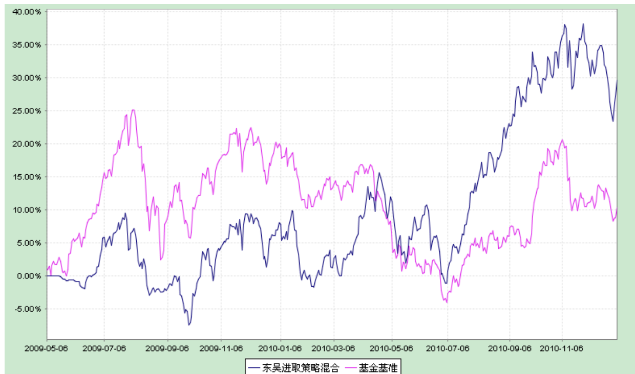
东吴进取策略灵活配置混合型开放式证券投资基金 份额累计净值增长率与业绩比较基准收益率历史走势对比图 (2009 年 5 月 6 日至 2010 年 12 月 31 日)

注：1、东吴进取策略基金于 2009 年 5 月 6 日成立。 2、比较基准=65%*沪深 300 指数+35%*中信标普全债指数。