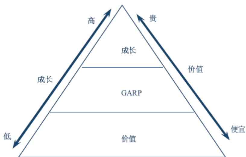
图 1 GARP 投资理念

② 对价值型公司的成长属性进行分析，可以发现相对投资价值较具成长性的股票，在成长潜力释放的过程中获得收益，规避市场价格未合理反映其成长性不足的股票。