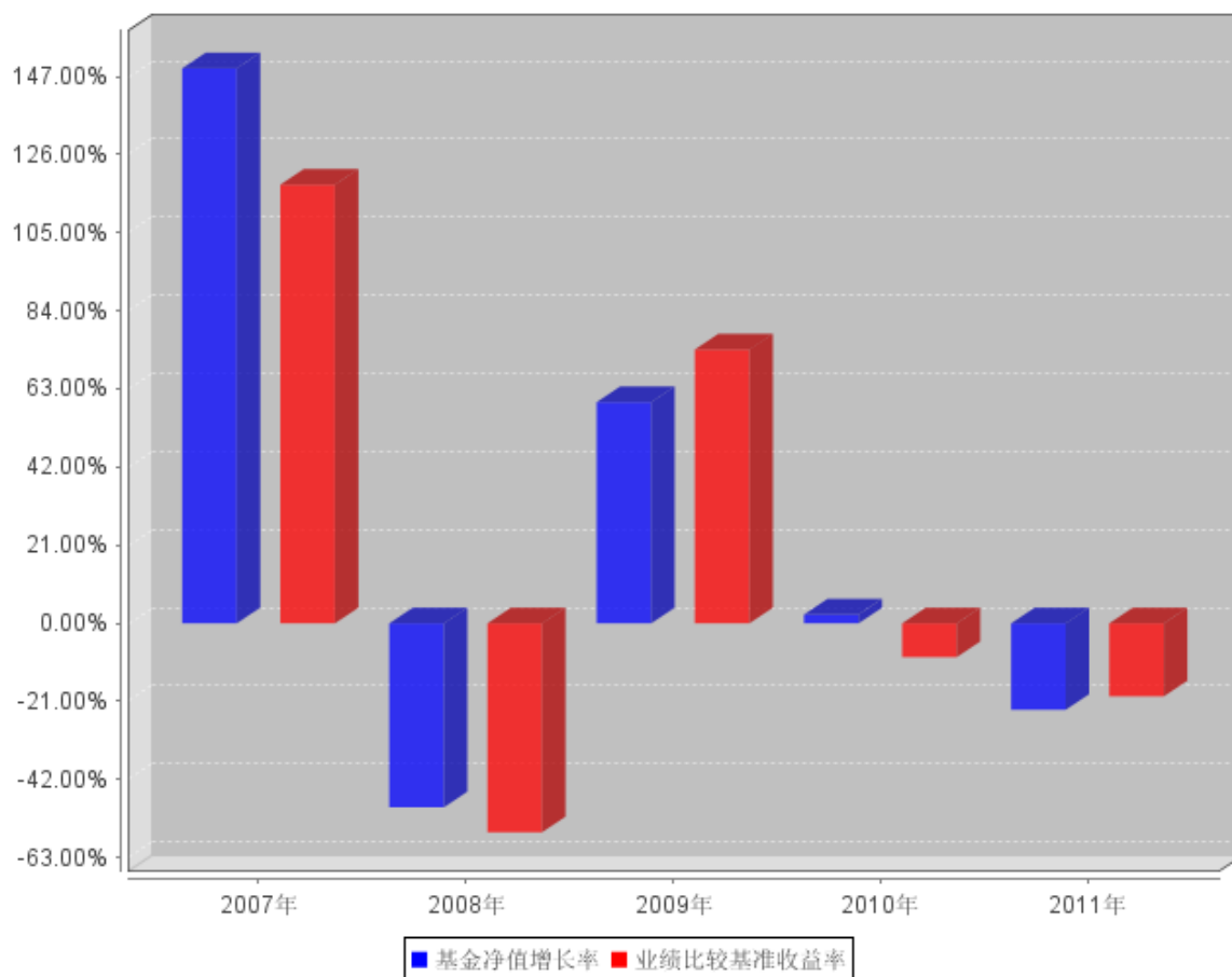
过去五年基金每年净值增长率及其与同期业绩比较基准收益率的对比图

注：本基金基金合同生效日为 2006 年 11 月 16 日，合同生效当年按实际存续期计算，不按整个自然年度进行折算。