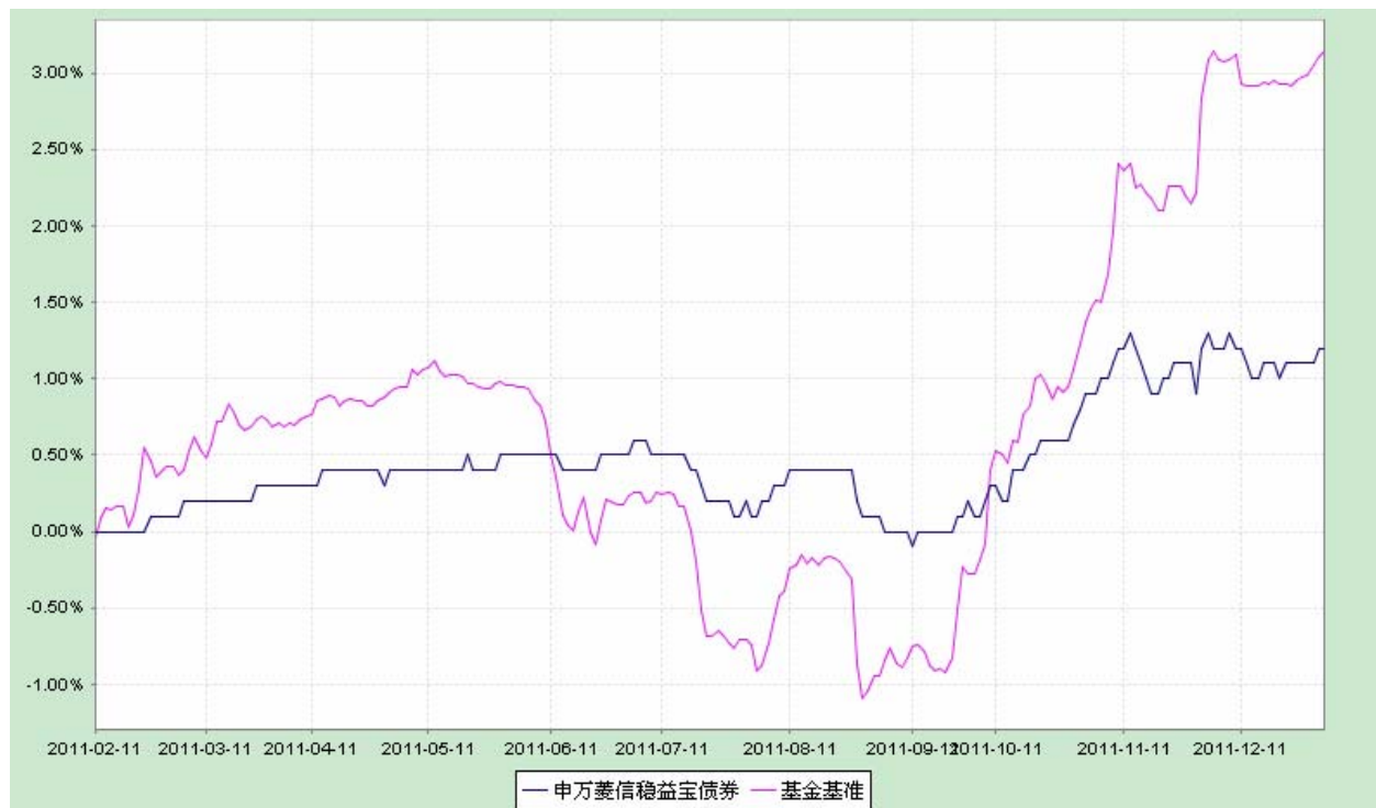
申万菱信稳益宝债券型证券投资基金 份额累计净值增长率与业绩比较基准收益率历史走势对比图 （2011年2月11日至2011年12月31日）