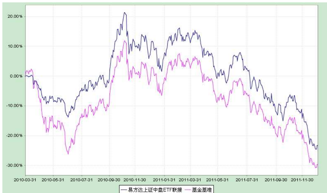
易方达上证中盘交易型开放式指数证券投资基金联接基金 份额累计净值增长率与业绩比较基准收益率历史走势对比图 (2010 年 3 月 31 日至 2011 年 12 月 31 日)