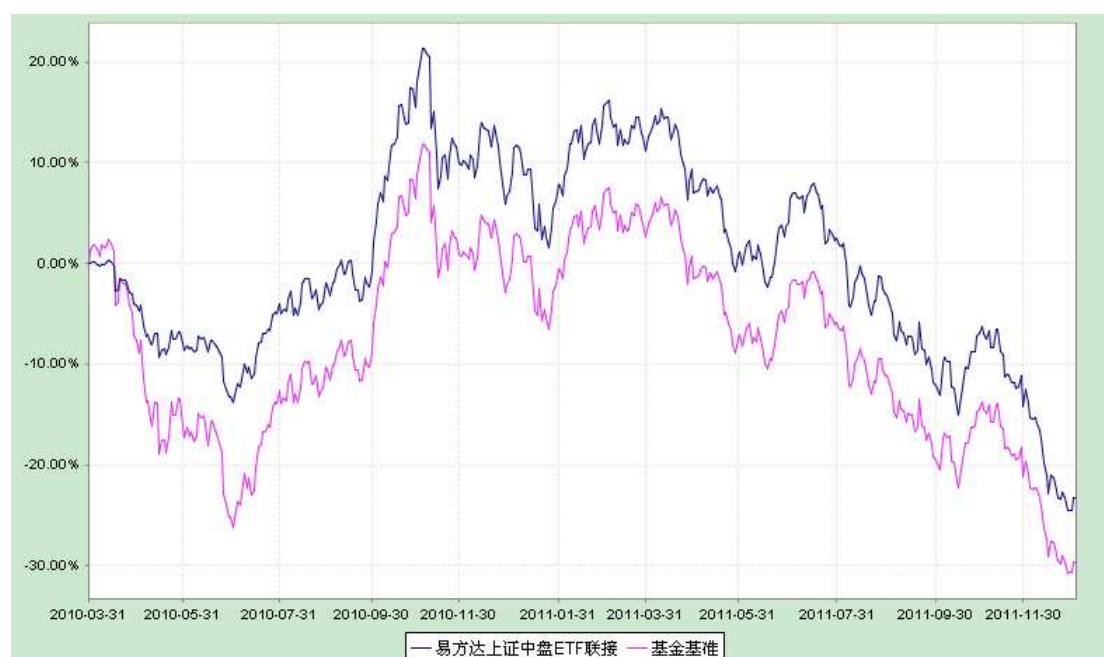
易方达上证中盘交易型开放式指数证券投资基金联接基金 份额累计净值增长率与业绩比较基准收益率历史走势对比图 (2010 年 3 月 31 日至 2011 年 12 月 31 日)