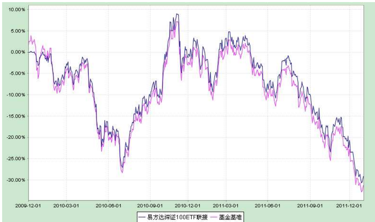
易方达深证 100 交易型开放式指数证券投资基金联接基金 份额累计净值增长率与业绩比较基准收益率历史走势对比图 (2009 年 12 月 1 日至 2011 年 12 月 31 日)