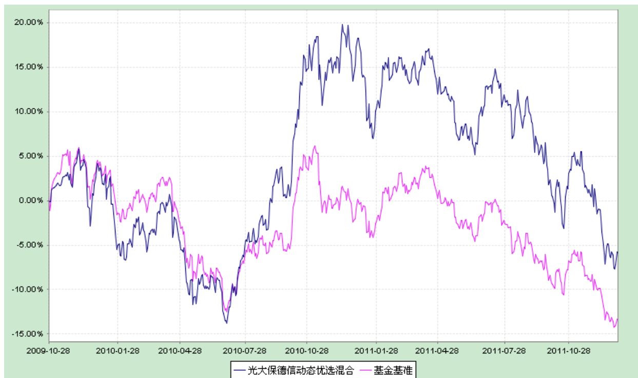
光大保德信动态优选灵活配置混合型证券投资基金 份额累计净值增长率与业绩比较基准收益率历史走势对比图 （2009 年 10 月 28 日至 2011 年 12 月 31 日）

注：根据基金合同的规定，本基金建仓期为 2009 年 10 月 29 日至 2010 年 4 月 28 日。建仓期结束时本基金各项资产配置比例符合本基金合同规定的比例限制及投资组合的比例范围。