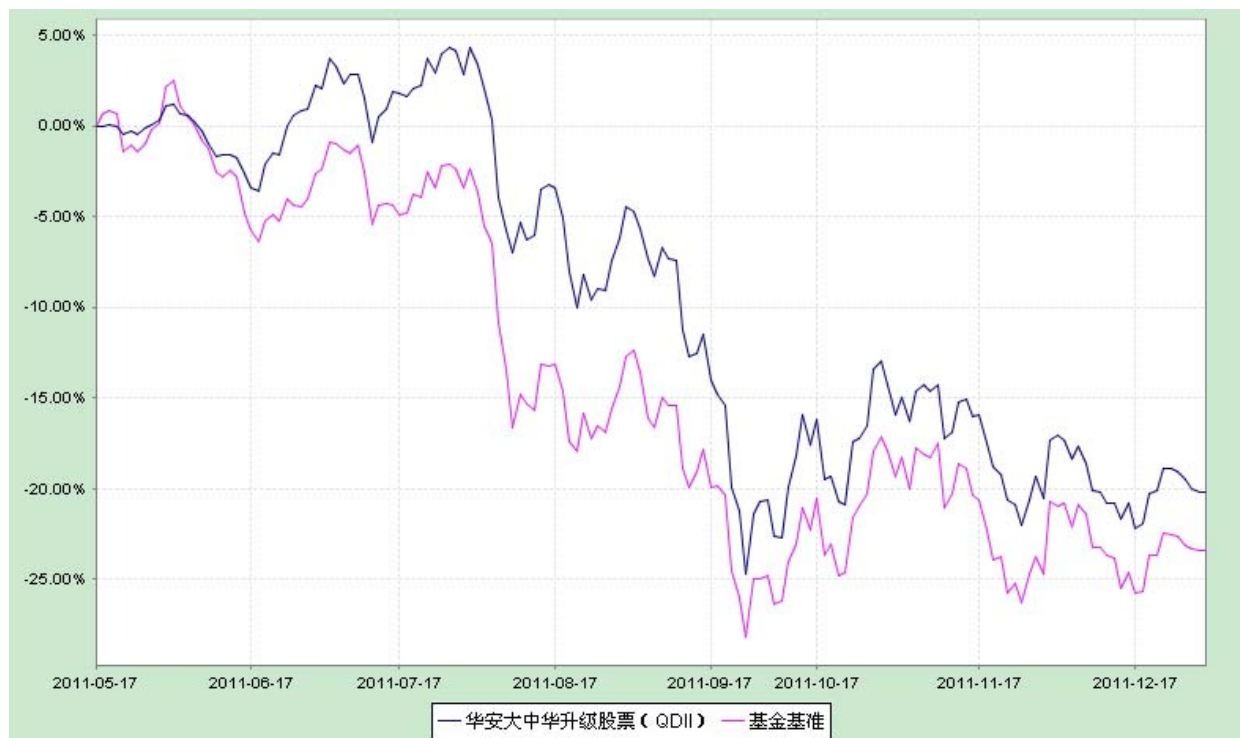
华安大中华升级股票型证券投资基金 份额累计净值增长率与业绩比较基准收益率历史走势对比图 (2011 年 5 月 17 日至 2011 年 12 月 31 日)

注：1. 本基金于 2011 年 5 月 17 日成立，截止本报告期末，本基金成立不满一年。