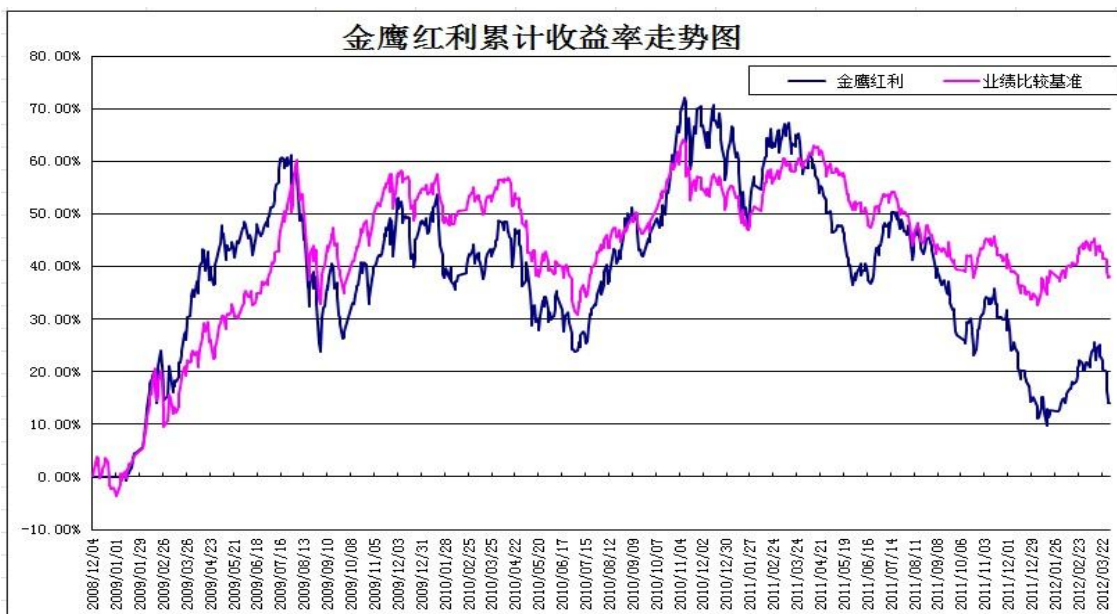
金鹰红利价值混合型基金累计份额净值增长率与同期业绩比较基准收益率的历史走势对比图（2008 年 12 月 4 日至 2012 年 3 月 31 日）

注：1、本基金合同于 2008 年 12 月 4 日正式生效；2、按基金合同规定，本基金自基金合同生效起六个月内为建仓期，截止报告日本基金的各项投资比例已达到基金合同规定的各项比例；3、本基金的业绩比较基准为：新华富时红利 150 指数收益率×60%+上证国债指数收益率×40%。