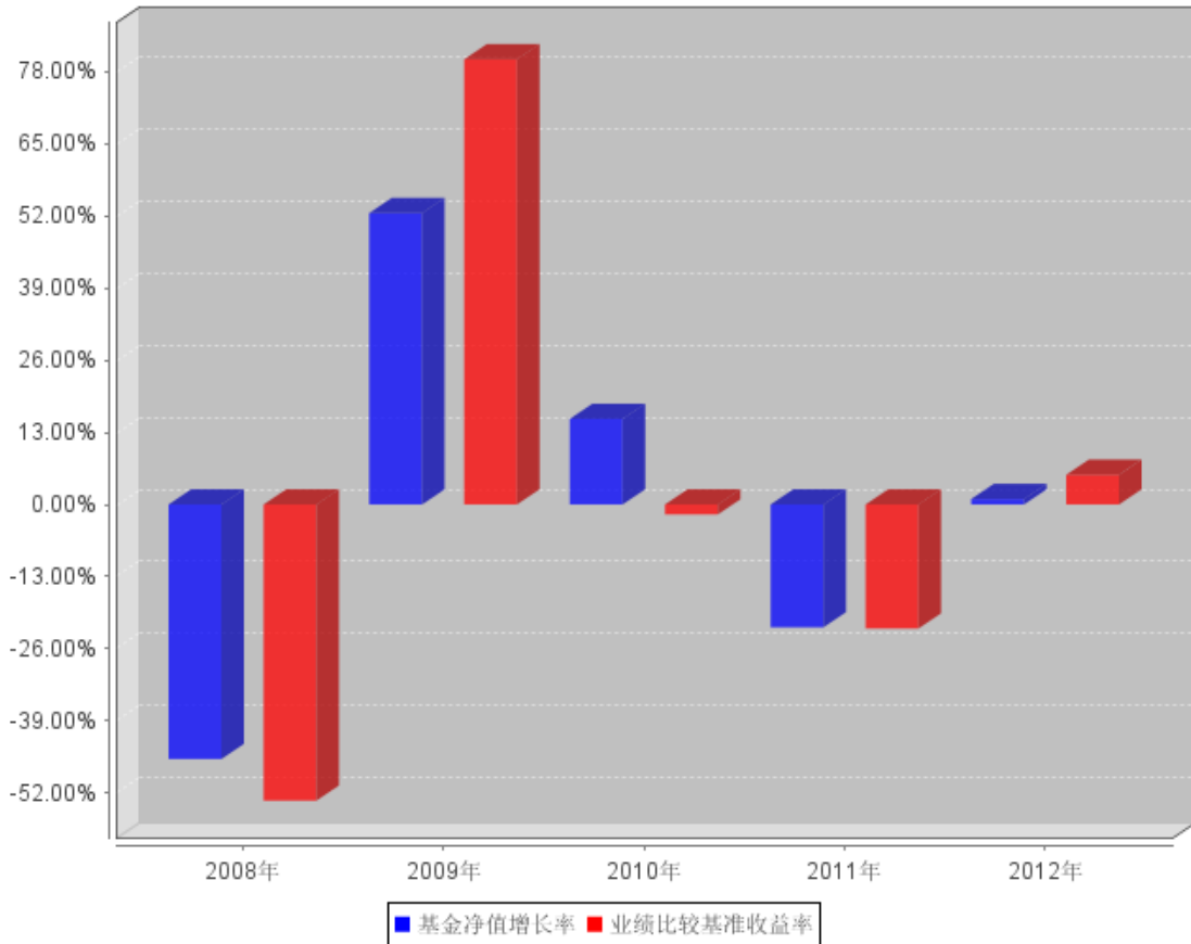
过去五年基金每年净值增长率及其与同期业绩比较基准收益率的对比图