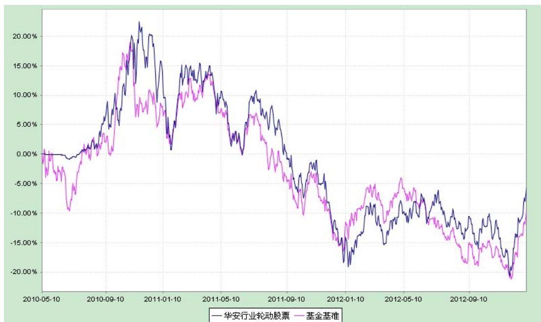
华安行业轮动股票型证券投资基金 份额累计净值增长率与业绩比较基准收益率历史走势对比图 (2010 年 5 月 11 日至 2012 年 12 月 31 日)