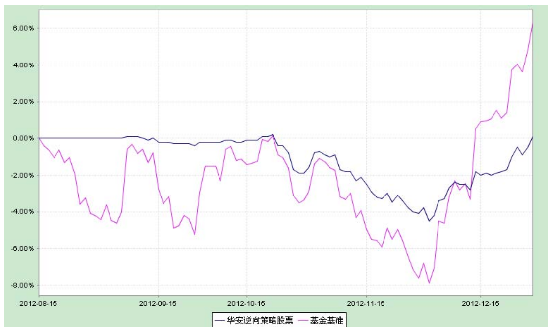
华安逆向策略股票型证券投资基金 份额累计净值增长率与业绩比较基准收益率历史走势对比图 (2012 年 8 月 16 日至 2012 年 12 月 31 日)

注: 1、本基金于 2012 年 8 月 16 日成立,截止本报告期末,本基金成立不满一年。