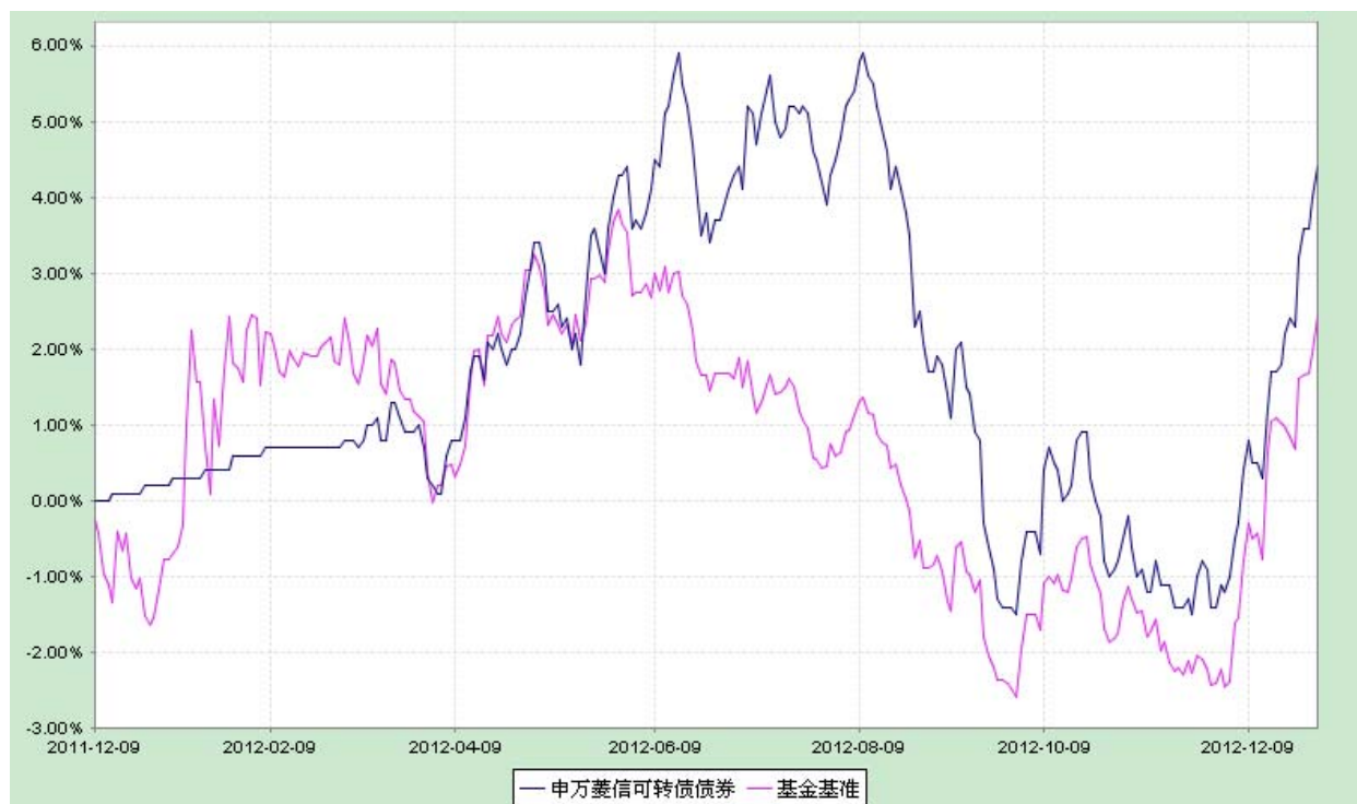
申万菱信可转换债券债券型证券投资基金 份额累计净值增长率与业绩比较基准收益率历史走势对比图 (2011 年 12 月 9 日至 2012 年 12 月 31 日)

注：本基金基金合同约定建仓期为基金合同生效之日起 6 个月。本基金已在基金合同生效之日起 6 个月内使基金的投资组合比例符合基金合同的有关约定。