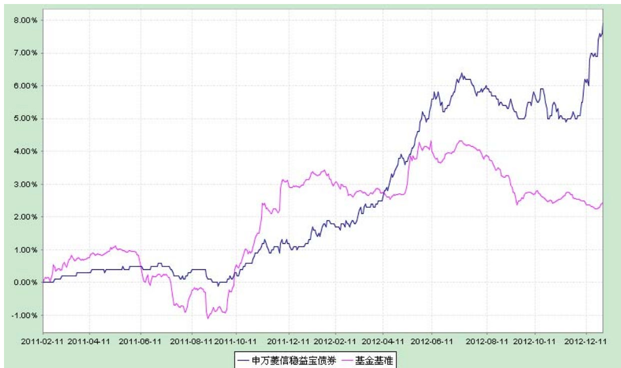
申万菱信稳益宝债券型证券投资基金 份额累计净值增长率与业绩比较基准收益率历史走势对比图 (2011 年 2 月 11 日至 2012 年 12 月 31 日)