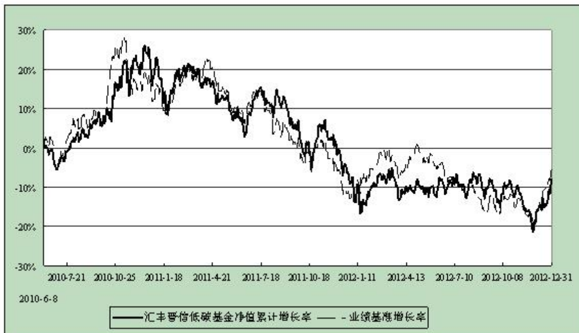
汇丰晋信低碳先锋股票型证券投资基金 份额累计净值增长率与业绩比较基准收益率历史走势对比图 (2010年6月8日至2012年12月31日)

注：1. 按照基金合同的约定，本基金的投资组合比例为：股票投资比例范围为基金资产的 85%-95%，权证投资比例范围为基金资产净值的 0%-3%。固定收益类证券、现金和其他资产投资比例范围为基金资产的 5%-15%，其中现金或到期日在一年以内的政府债券的投资比例不低于基金资产净值的 5%。本基金自基金合同生效日起不超过六个月内完成建仓。截止 2010 年 12 月 8 日，本基金的各项投资比例已达到基金合同约定的比例。