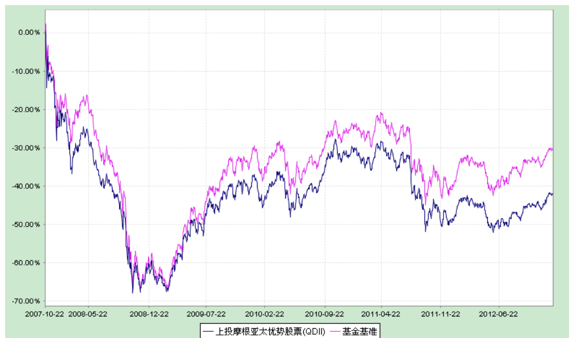
上投摩根亚太优势股票型证券投资基金 份额累计净值增长率与业绩比较基准收益率历史走势对比图 （2007 年 10 月 22 日至 2012 年 12 月 31 日）

注：1. 本基金合同生效日为 2007 年 10 月 22 日，图示时间段为 2007 年 10 月 22 日至 2012 年 12 月 31 日。 2. 本基金建仓期自 2007 年 10 月 22 日至 2008 年 4 月 21 日，建仓期结束时资产配置比例符合本基金基金合同规定。