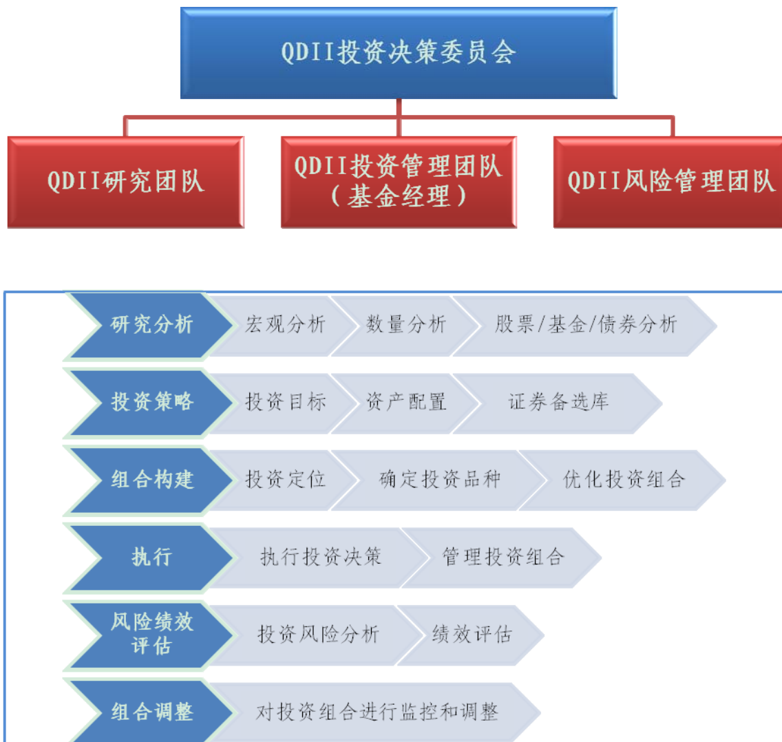
图 2: QDII 投资决策机制和投资管理流程