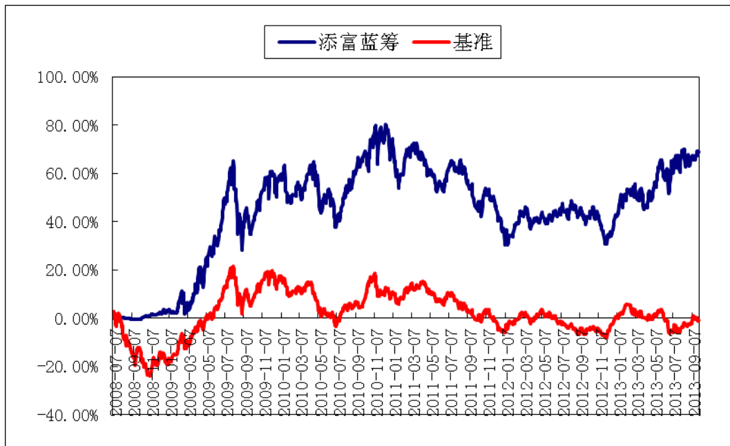
（二）自基金合同生效以来基金累计净值增长率变动及其与同期业绩比较基准收益率变动的比较图