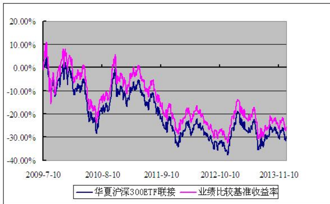
华夏沪深 300 交易型开放式指数证券投资基金联接基金 份额累计净值增长率与业绩比较基准收益率历史走势对比图 (2009 年 7 月 10 日至 2013 年 12 月 31 日)