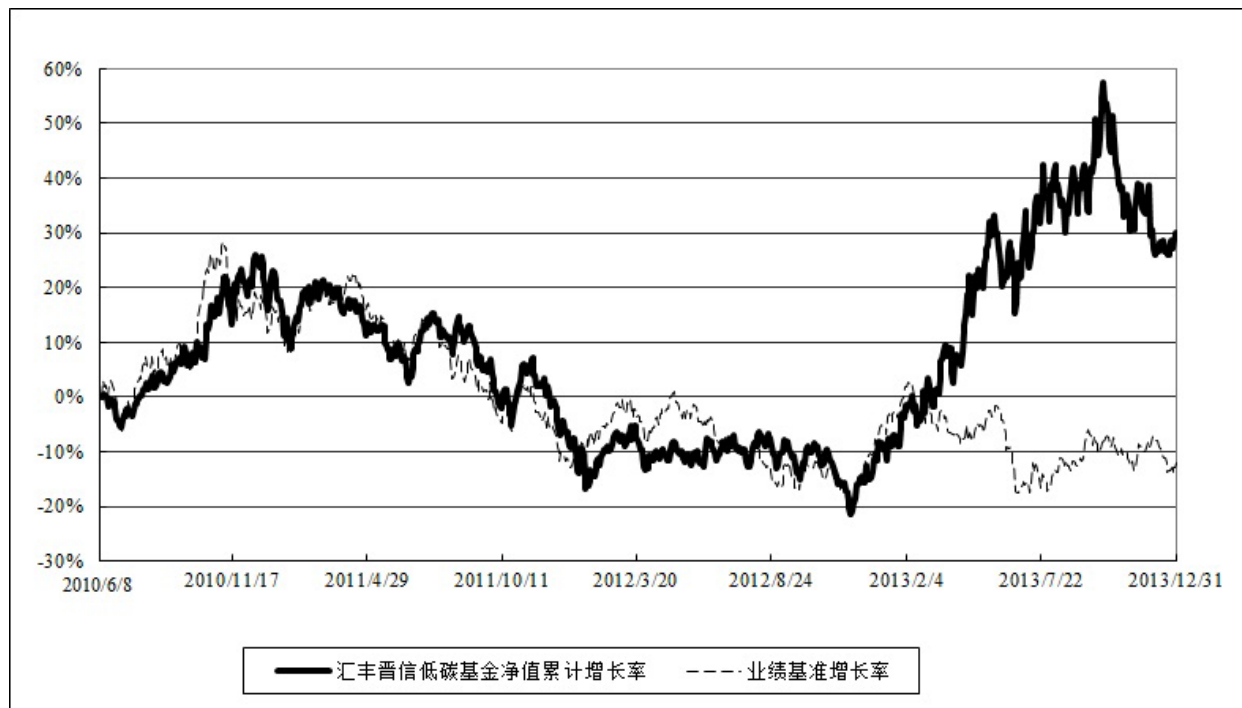
汇丰晋信低碳先锋股票型证券投资基金 份额累计净值增长率与业绩比较基准收益率历史走势对比图 (2010年6月8日至2013年12月31日)

注：1.按照基金合同的约定，本基金的投资组合比例为：股票投资比例范围为基金资产的 85%-95%，权证投资比例范围为基金资产净值的 0%-3%。固定收益类证券、现金和其他资产投资比例范围为基金资产的 5%-15%，其中现金或到期日在一年以内的政府债券的投资比例不低于基金资产净值的 5%。本基金自基金合同生效日起不超过六个月内完成建仓。截止 2010 年 12 月 8 日，本基金的各项投资比例已达到基金合同约定的比例。