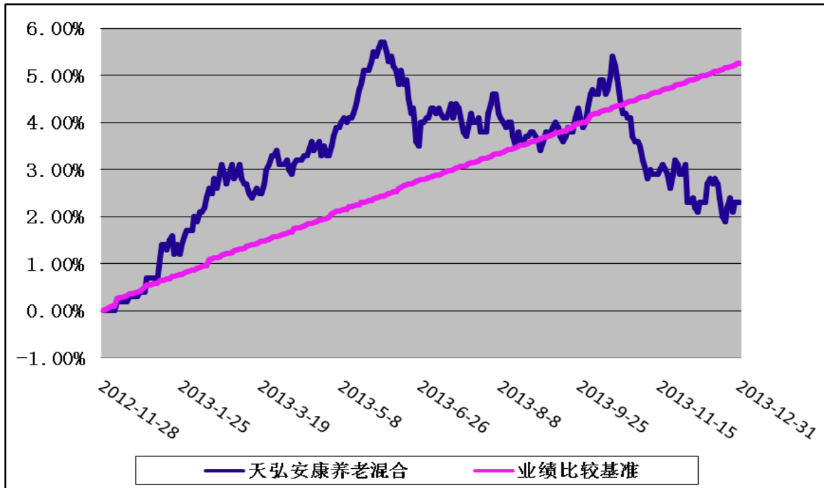
天弘安康养老混合型证券投资基金 份额累计净值增长率与业绩比较基准收益率历史走势对比图 (2012年11月28日-2013年12月31日)