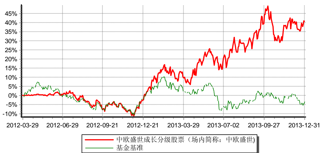
中欧盛世成长分级股票型证券投资基金 份额累计净值增长率与业绩比较基准收益率历史走势对比图 (2012年3月29日-2013年12月31日)

注：注：本基金合同生效日为2012年3月29日，建仓期为2012年3月29日至2012年9月28日，建仓期结束时各项资产配置比例符合本基金基金合同规定。