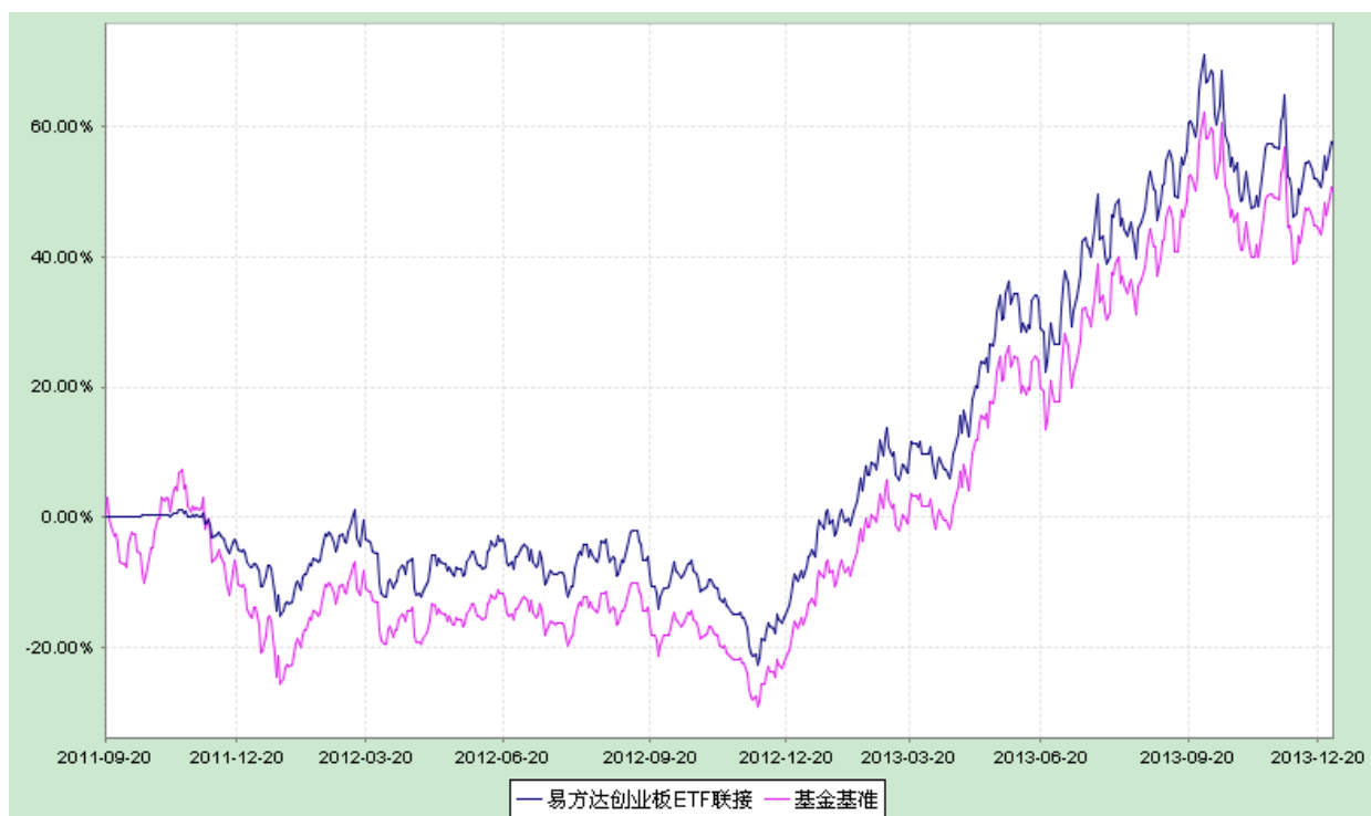
易方达创业板交易型开放式指数证券投资基金联接基金 份额累计净值增长率与业绩比较基准收益率历史走势对比图 (2011 年 9 月 20 日至 2013 年 12 月 31 日)