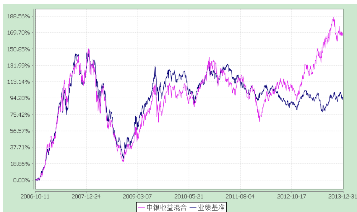
中银收益混合型证券投资基金 份额累计净值增长率与业绩比较基准收益率的历史走势对比图 (2006 年 10 月 11 日至 2013 年 12 月 31 日)

注：按基金合同规定，本基金自基金合同生效起 6 个月内为建仓期，截至建仓结束时本基金的各项投资比例已达到基金合同第十一部分(二)的规定，即本基金投资组合中股票资产投资比例为 30-90%，债券资产比例为 0-65%，现金或者到期日在一年以内的政府债券类资产比例最低不低于 5%。