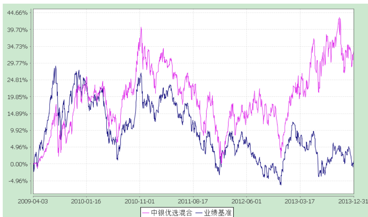
中银行业优选灵活配置混合型证券投资基金 份额累计净值增长率与业绩比较基准收益率的历史走势对比图 (2009年4月3日至2013年12月31日)

注：按基金合同规定，本基金自基金合同生效起 6 个月内为建仓期，截至建仓结束时本基金的各项投资比例已达到基金合同第十一部分（二）的规定，即本基金投资组合中，股票投资的比例范围为基金资产的 30%—80%；债券、权证、资产支持证券、货币市场工具及国家证券监管机构允许基金投资的其他金融工具占基金资产的比例范围为 20—70%；其中现金或者到期日在一年以内的政府债券不低于基金资产净值的 5%，持有权证的市场不超过基金资产净值的 3%。对于中国证监会允许投资的创新金融产品，将依据有关法律法规进行投资管理。