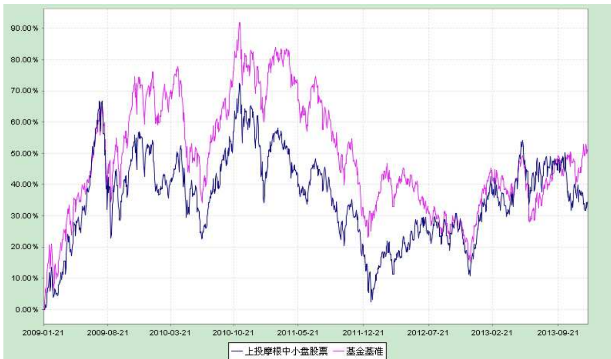
上投摩根中小盘股票型证券投资基金 份额累计净值增长率与业绩比较基准收益率历史走势对比图 (2009年1月21日至2013年12月31日)

注：1. 本基金建仓期自2009年1月21日至2009年7月20日，建仓期结束时资产配置比例符合本基金基金合同规定。