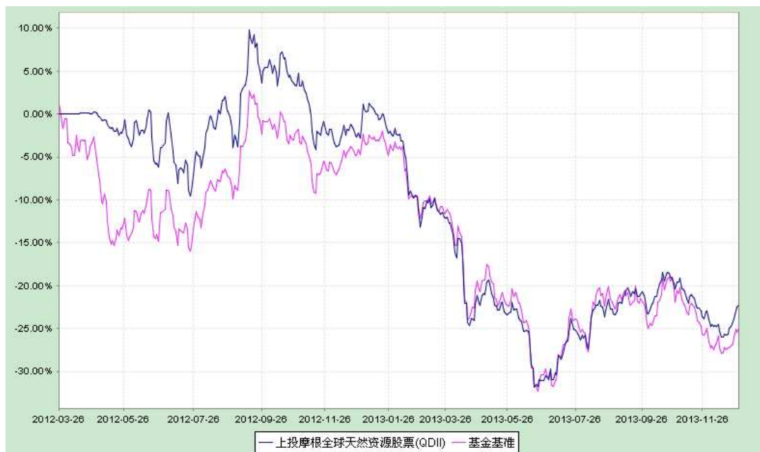
上投摩根全球天然资源股票型证券投资基金 份额累计净值增长率与业绩比较基准收益率历史走势对比图 （2012年3月26日至2013年12月31日）

注：1. 本基金合同生效日为2012年3月26日，图示时间段为2012年3月26日至2013年12月31日。