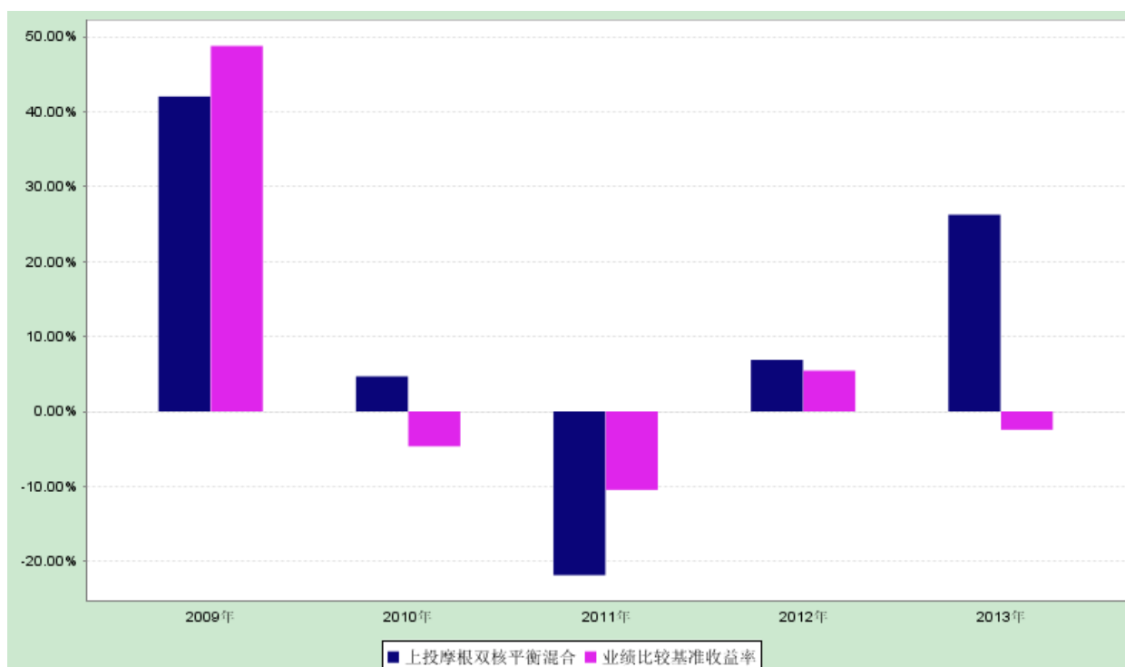
过去五年基金净值增长率与业绩比较基准收益率的对比图