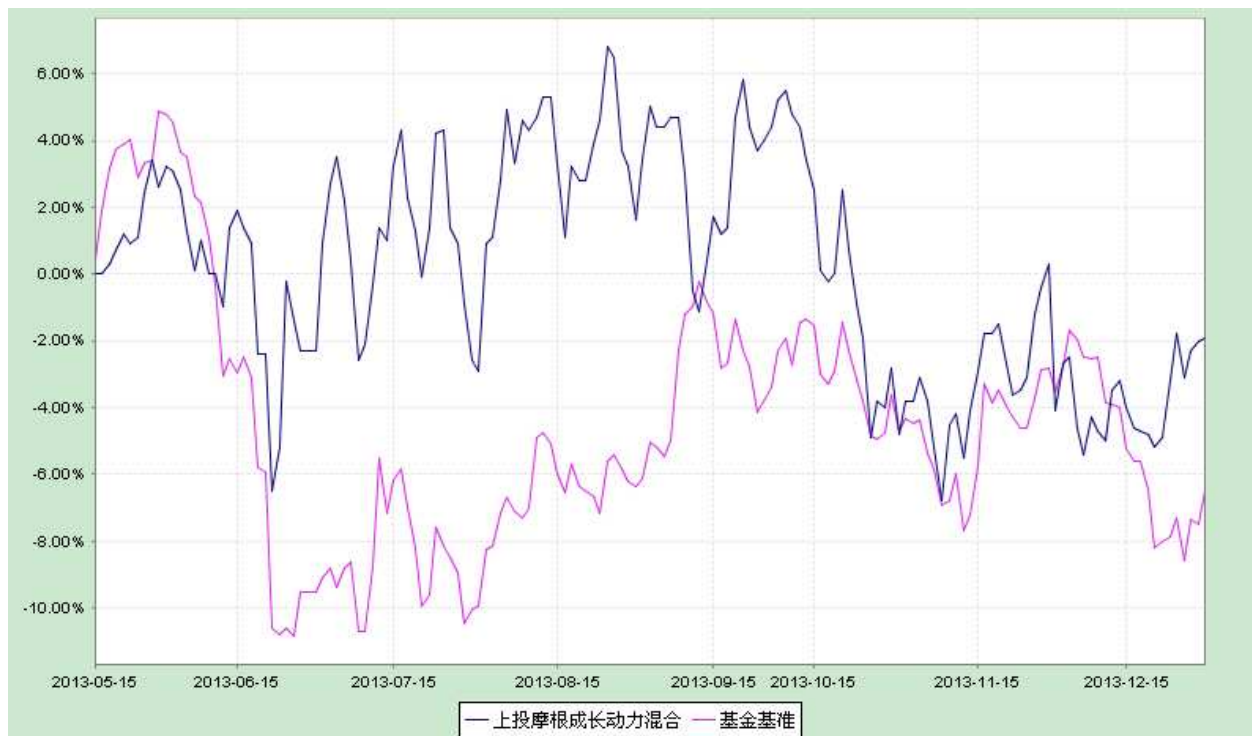
上投摩根成长动力混合型证券投资基金 份额累计净值增长率与业绩比较基准收益率历史走势对比图 (2013年5月15日至2013年12月31日)

注：本基金建仓期自2013年5月15日至2013年11月14日，建仓期结束时资产配置比例符合本基金基金合同规定。本基金合同生效日为2013年5月15日，图示时间段为2013年5月15日至2013年12月31日。