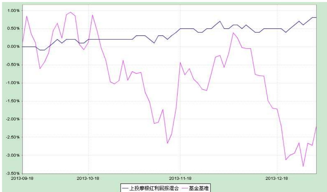
上投摩根红利回报混合型证券投资基金 份额累计净值增长率与业绩比较基准收益率历史走势对比图 (2013 年 9 月 18 日至 2013 年 12 月 31 日)

注：本基金合同生效日为 2013 年 9 月 18 日，截至报告期末本基金合同生效未满一年。