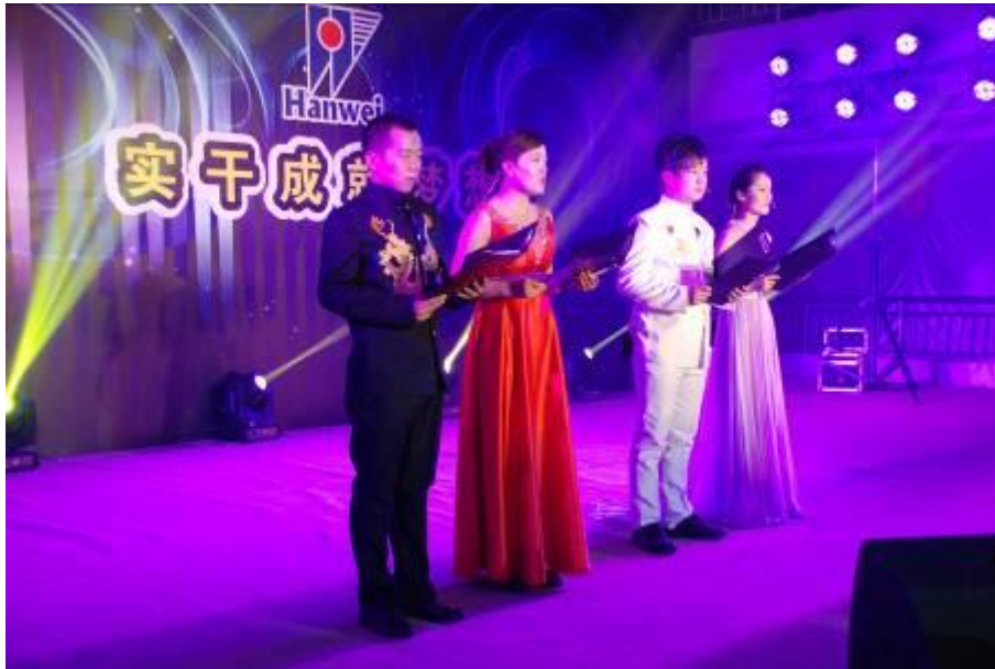
图 7 2014 年联欢年会现场