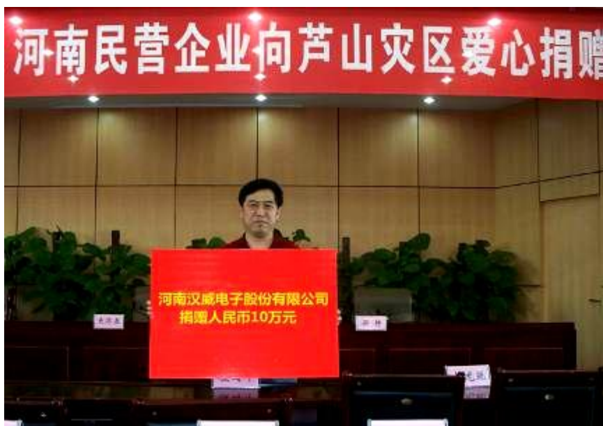
8 公 安灾

2013年4月，四川雅安发生地震，一方有难，八方支援。公司随即在内部发起“汇聚我们的爱，用爱照亮希望”爱心募捐活动，汉威人用微薄之力，给雅安带去更多的信心和希望。4月25日，“情系芦山·同心共助”河南民营企业向芦山灾区爱心捐赠仪式在郑州举行，汉威电子积极参与本次捐赠仪式并捐款10万元（见图8）。