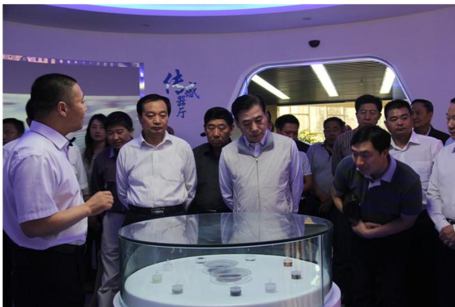
图 11 商会 企业家代

2013 年 10 月 11 日，河南省豫南商会举行非公人士理想信念教育实践活动座谈会，60 多位企业家代表齐聚汉威电子，畅谈中国梦与企业发展，共同探讨产业报国的实现路径。（见图 11）