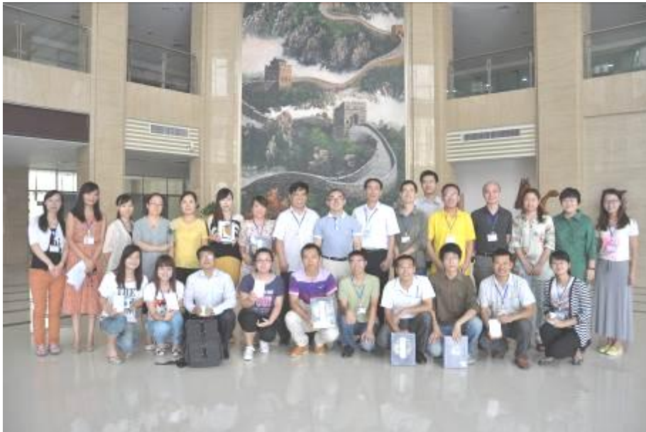
图 6 “15 年·我们正青春”征文活动及摄影比赛颁奖合影

征文及摄影比赛：2013 年 9 月，为献礼汉威电子 15 周年司庆，丰富汉威企业文化，由汉威电子管控中心、党支部、工会联合会、《威风》编辑部、威视界影音俱乐部发起了“15 年·我们正青春”有奖征文活动及第二届摄影比赛。大家积极响应，用文字和镜头记录汉威工作、生活之美（见图 6）。