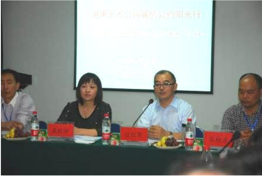
图 3 河南上