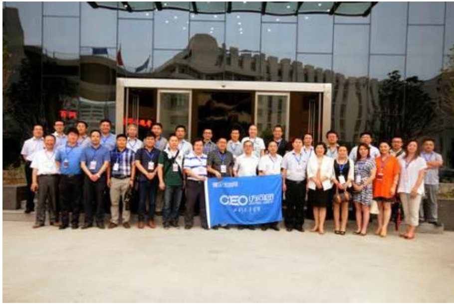
图 9 豫企五百网 CEO 访问团参观公司

2013 年 8 月，公司联合河南省工商联、郑州市工商联、郑州市信息化促进会、郑州高新区管委会和北京和君咨询集团，举办了盛大的“立中原·论发展”高峰论坛，邀请北京和君咨询集团副总裁王丰博士以“宏观大势与企业发展”为主题，为中原企业做了精彩公开演讲。汉威电子作为中原经济区首批创业板上市企业，邀请中国著名咨询专家，将先进的战略、管理理念在中原地区的企业间宣传推广，增进了与中原经济区的其他企业进行了沟通交流，后期还将通过其他更多形式为中原经济区崛起贡献更多的能量（见图 10）。