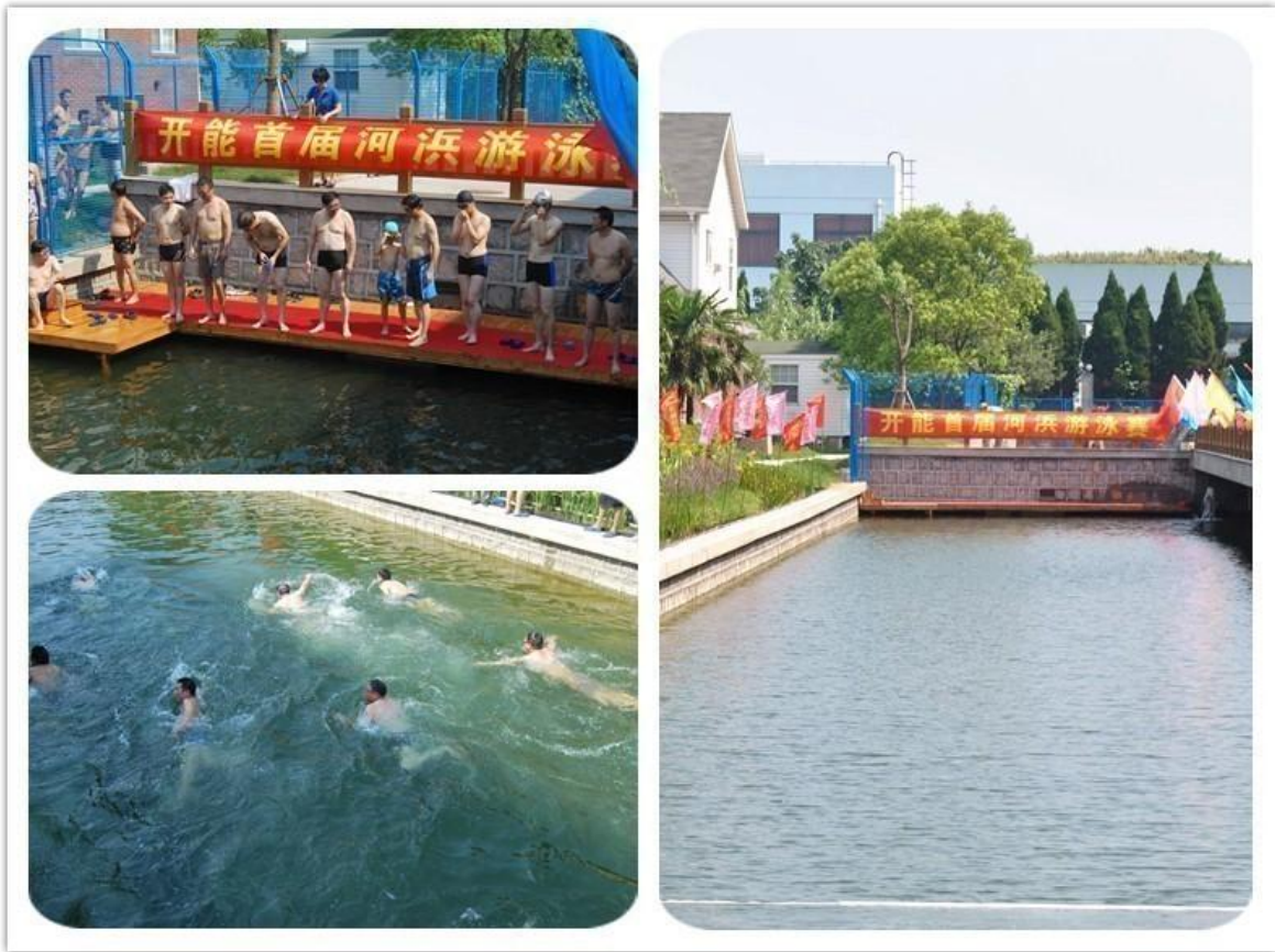
园区内的河道净化效果良好，成功举办游泳比赛

具匠心的污水、废水回收、回用设计、创新实用的污水零排放功能获得国际、国内来访者的极大好评。开能环保工业园的旅游项目将成为未来迪斯尼旅游度假区旅游配套设施的组成部分。同时，这也是公司传播健康用水理念和生活方式、引导客户认知开能品牌和产品的一个窗口。