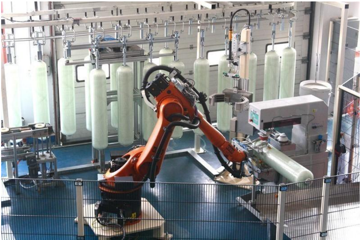
德国自动化系统大大提高核心部件生产效率

2013年，公司自主研发设计的85HE多路控制阀投入使用，该多路控制阀实现了顺流/逆流再生可选功能，步进式吸盐，根据原水类别设定不同再生模式及紧急条件下20分钟短时间再生确保水质等先进功能，与业内同类产品相比，运行过程中可节约用水成本58%，节约用盐成本75%，获得客户的广泛好评。公司自主研发制造的采用膜技术的终端净水器和自主研发制造的膜元件也在年内投入市场，并获得了良好的反响。年内公司获得新区工会“职工创新奖”、“自动多路控制阀浦东新区职工科技创新三等奖”等多项奖励和专利。在核心技术产品制造系统方面，获得国家发改委支持的募投项目《智能化家用中央水处理设备及商用净化饮水机生产基地项目》建设接近尾声，其中实现全自动化生产的重要生产环节集中供料系统已经投入使用。公司与德国供应商合作设计的复合材料压力容器全自动生产线在报告期内基本完成安装调试，这套全球首创的自动化生产系统将极大地提升复合材料压力容器的生产效率，降低制造成本。这套系统的创新建设完成，将进一步提升公司的竞争优势，奠定行业领先地位。