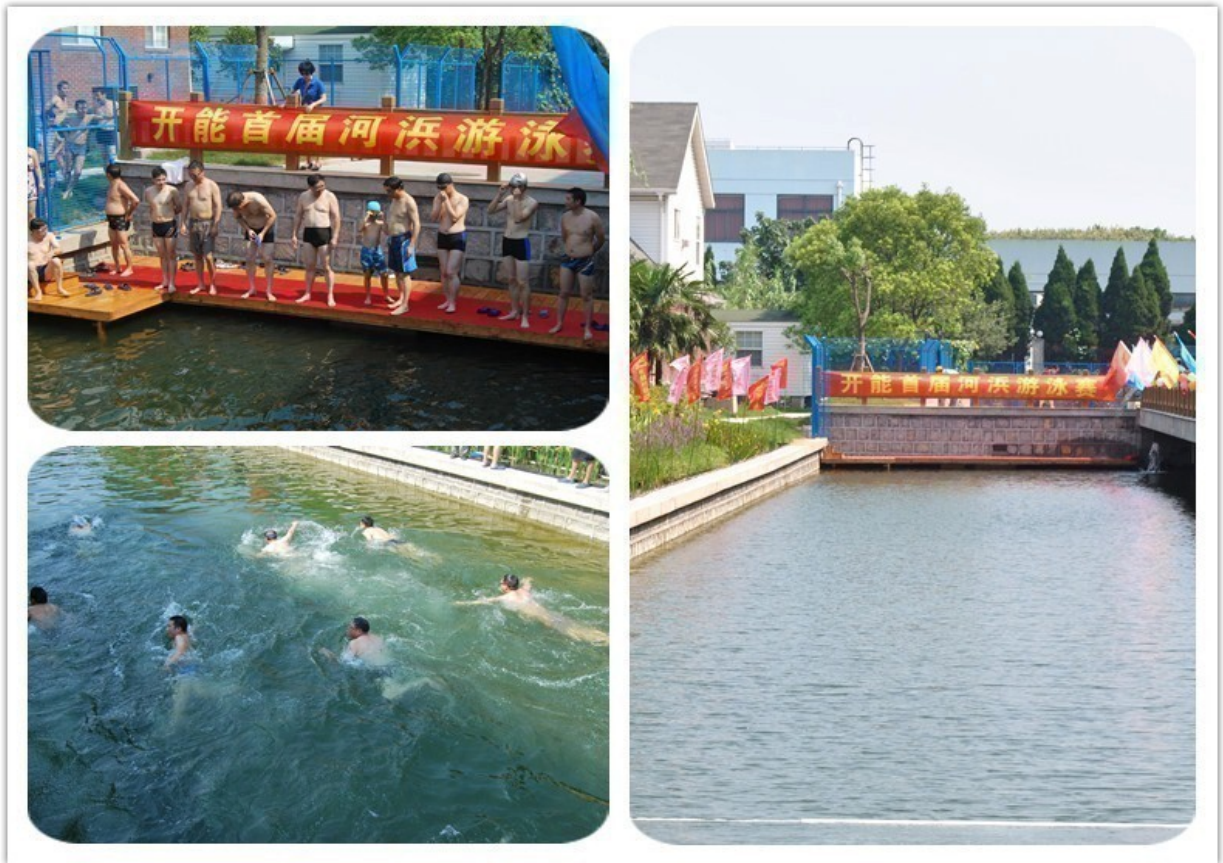
园区内的河道净化效果良好，成功举办游泳比赛