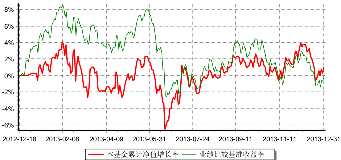
安信平稳增长混合型发起式证券投资基金 份额累计净值增长率与业绩比较基准收益率历史走势对比图 (2012年12月18日-2013年12月31日)

注：1、本基金的建仓期为2012年12月18日至2013年6月17日，建仓期结束时，本基金各项资产配置比例均符合本基金合同的约定。