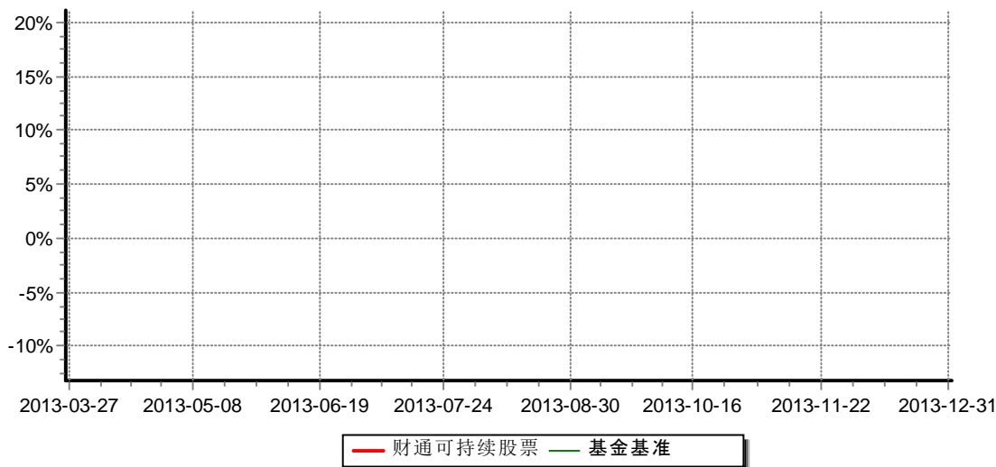
财通可持续发展主题股票型证券投资基金 份额累计净值增长率与业绩比较基准收益率历史走势对比图 （2013年3月27日-2013年12月31日）

注：（1）本基金合同生效日为2013年3月27日，基金合同生效起至披露时点不满一年；