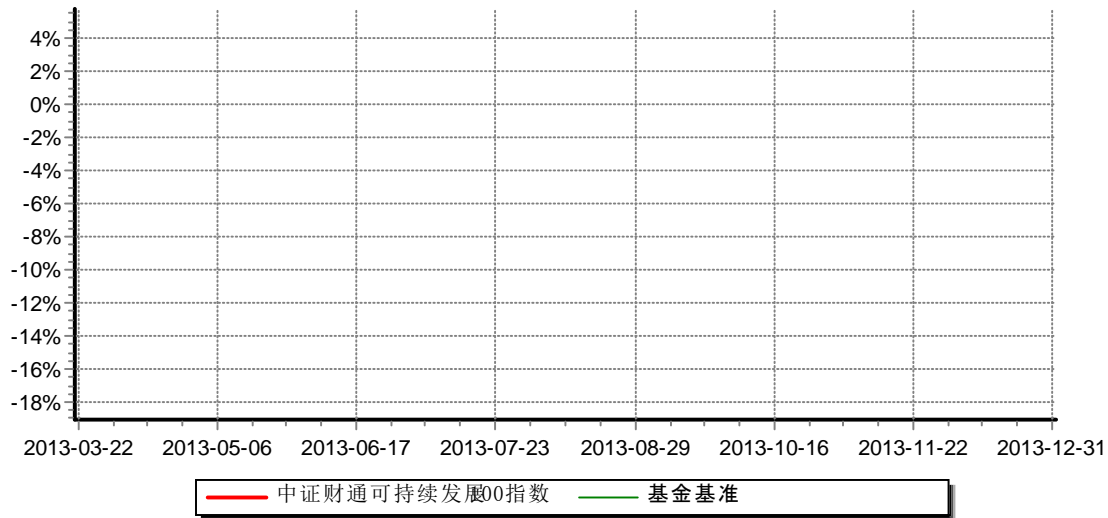
中证财通中国可持续发展100(ECPI ESG)指数增强型证券投资基金 份额累计净值增长率与业绩比较基准收益率历史走势对比图 （2013年03月22日-2013年12月31日）

注：（1）本基金合同生效日为2013年3月22日，基金合同生效起至披露时点不满一年；