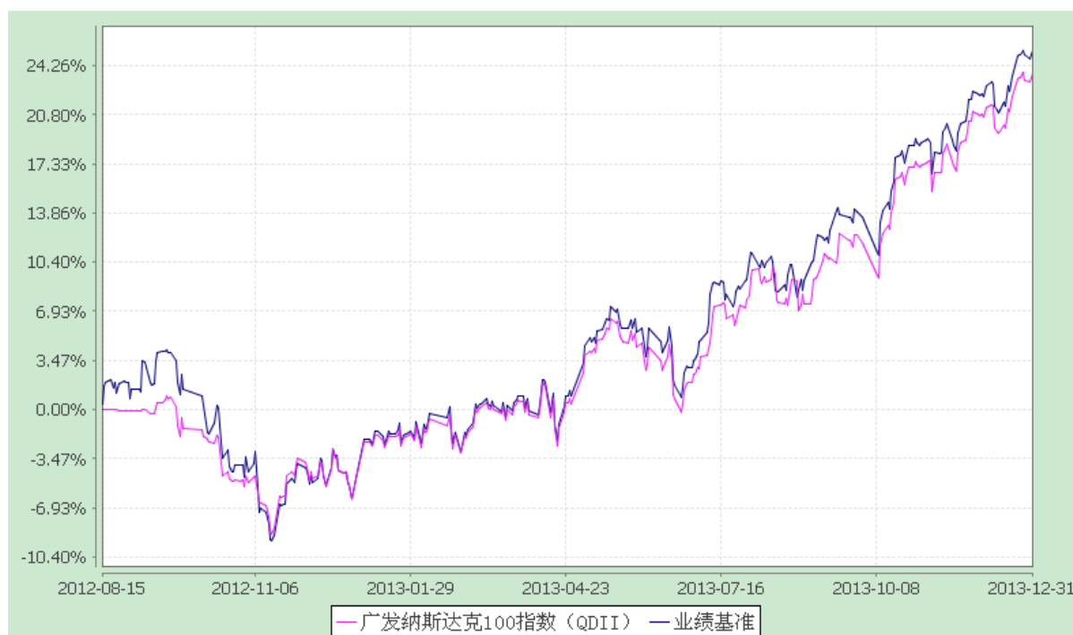
广发纳斯达克 100 指数证券投资基金 份额累计净值增长率与业绩比较基准收益率历史走势对比图 (2012 年 8 月 15 日至 2013 年 12 月 31 日)