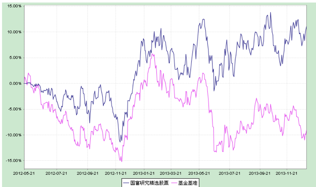
富兰克林国海研究精选股票型证券投资基金 份额累计净值增长率与业绩比较基准收益率历史走势对比图 (2012 年 5 月 22 日至 2013 年 12 月 31 日)

注：本基金的基金合同生效日为 2012 年 5 月 22 日。本基金在 6 个月建仓期结束时，各项投资比例符合基金合同约定。