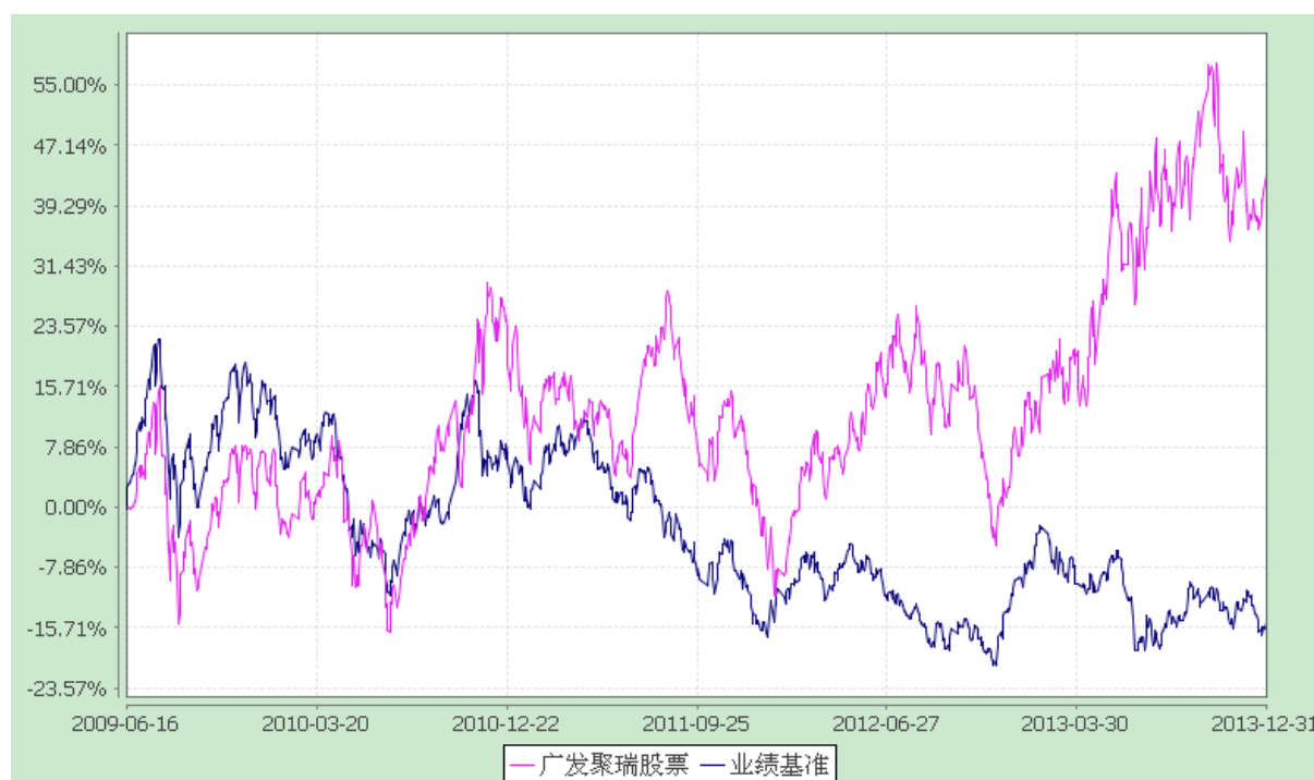
份额累计净值增长率与业绩比较基准收益率的历史走势对比图 (2009 年 6 月 16 日至 2013 年 12 月 31 日)