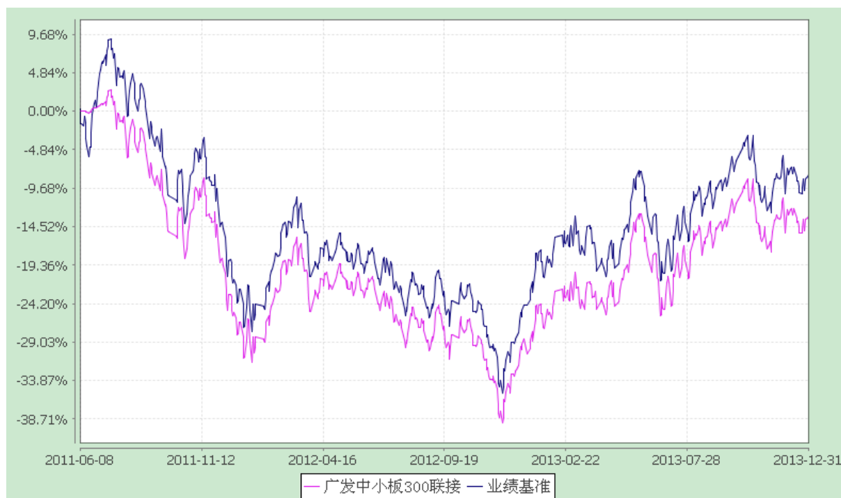
广发中小板 300 交易型开放式指数证券投资基金联接基金 份额累计净值增长率与业绩比较基准收益率的历史走势对比图 (2011 年 6 月 9 日至 2013 年 12 月 31 日)